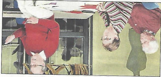
Les responsables de l'association ont fait part de leurs re-

marques. Il a, source de mauvaises odeurs et de poussières, qui du casier d'amiante et à la fermeture ont demandé la fermeture de la majorité la fermeture de tout le compostage, des négociations sont en cours avec la municipalité et le Syndromme concernant son devenir. Les participants ont applaudi Mme le maire et son conseil municipal qui, à l'unanimité pas été atteint.