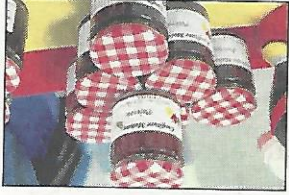
Un exemple de produit que vous pourrez trouver au salon.