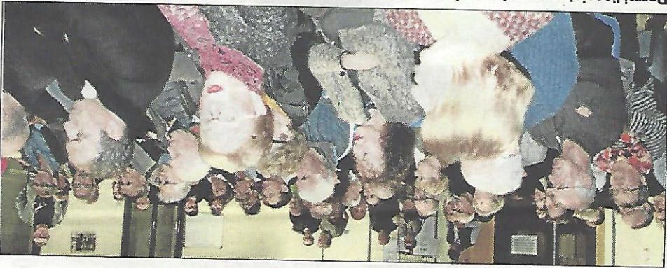
Parmi l'assistance se trouvaient quelques habitants de Clair.